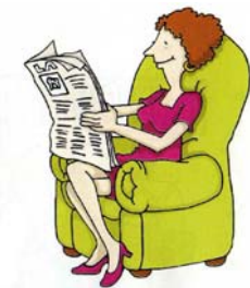
LA MAMMA LEGGE IL GIORNALE