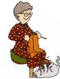
LA NONNA FA LA MAGLIA