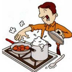
IL PAPA' CUCINA LA PASTA