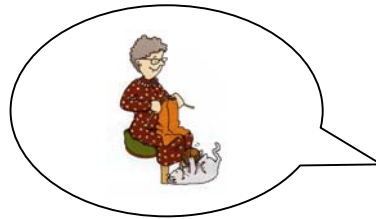
LA NONNA .....