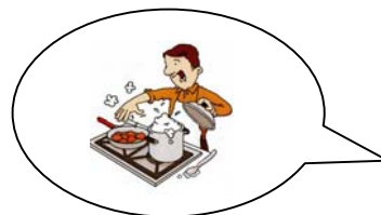
IL PAPA' .....